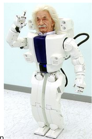
Un modèle de Hubo avec le masque d'Albert Einstein

Kismet, ICat, Emuu, Sparky, Hubo, Pino, ou encore le bébé phoque Paro sont autant de robots dont l'évolution devrait progresser vers une plus grande capacité thérapeutique.