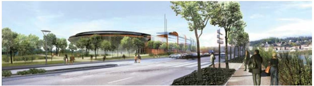
La salle 3000 par Renzo Piano

Destinée à faire de Lyon une des toutes premières destinations européennes en matière de tourisme d'affaires, le Grand amphithéâtre du Palais des Congrès, dessiné par Renzo Piano, pourra accueillir de 900 à 3 220 personnes et sera accompagné d'une place publique de 4000 m 2 , d'un grand hôtel supplémentaire, de pavillons de bureaux et d'exposition.