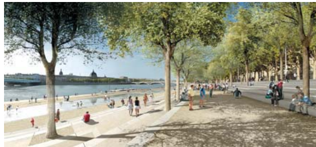
Le projet de réaménagement des berges du Rhône

Le Grand Lyon souhaite renforcer les collaborations entre acteurs des biotechnologies (60 000 emplois) à travers le projet Bioparc : à proximité du très grand pôle hospitalo-universitaire de l'Est de Lyon, il accueillera en 2005 entreprises et unités de recherche dans le domaine de la santé (en particulier du cancer via le canceropôle).