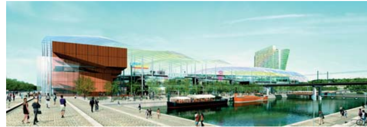
Le projet de pôle de loisirs du Confluent

Ce site exceptionnel de 150 hectares entre Saône et Rhône au Sud de Perrache va peu à peu être désenclavé et doté d'équipements de dimension métropolitaine : Pôle de loisirs le long d'une "place nautique" créée de toute pièce, Musée des Confluences, prolongation de la ligne de tramway, etc.